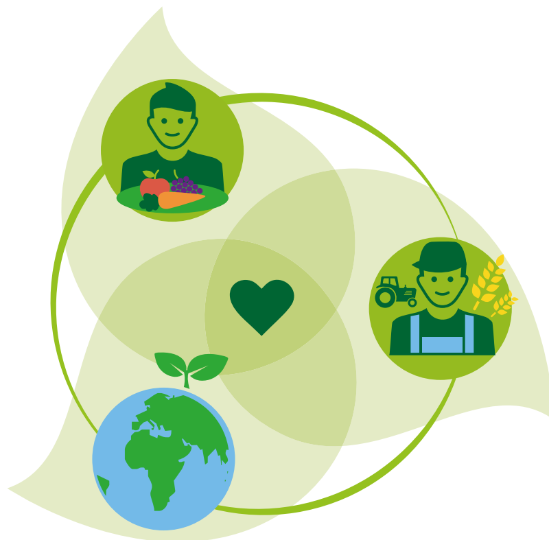
Figuur 1. Gezondheid in Drievoud symbolisch weergegeven, RIDLV 2021.