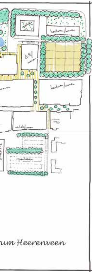
Vorstel voor het centrum van Heerenveen door de 'werkplaats ontmoeten', onderdeel van het burgerberaad in 2019.