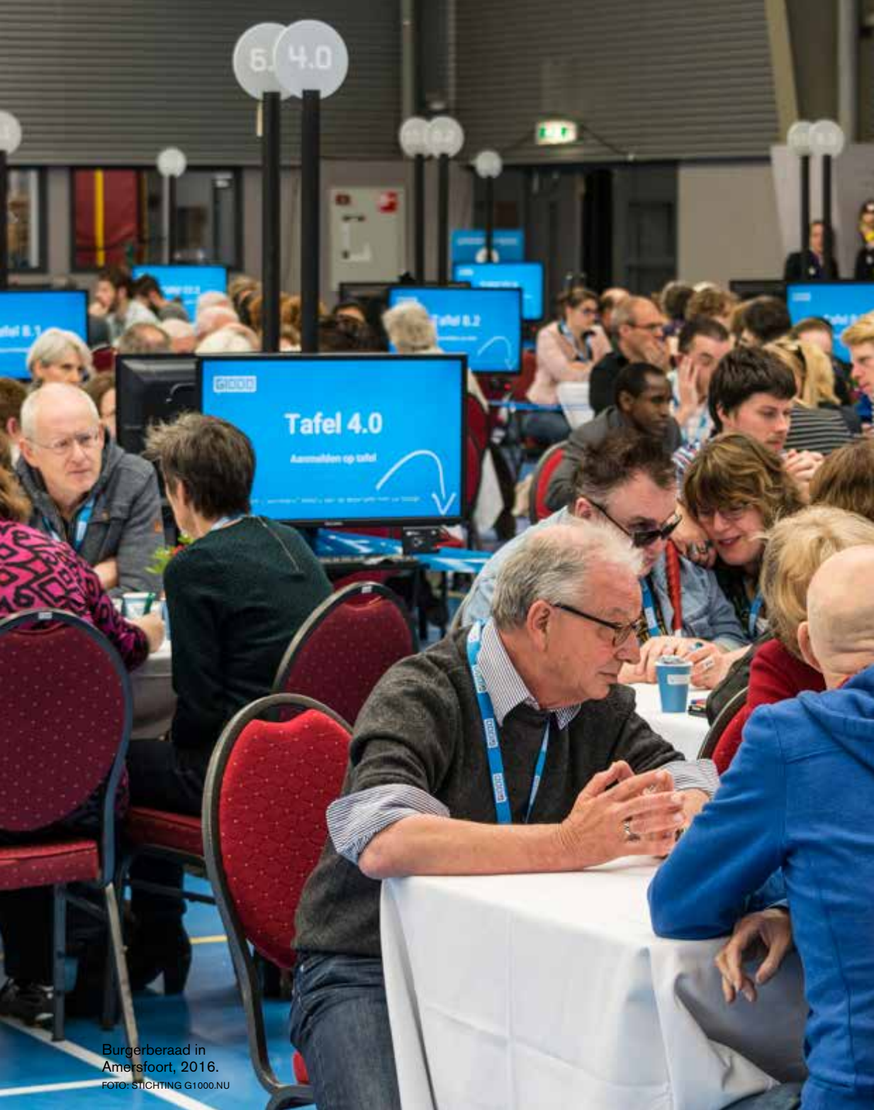
Burgerberaad in Amersfoort, 2016.